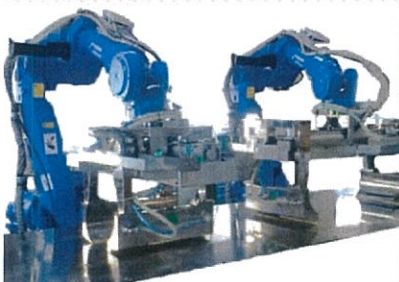
食材練り込み装置